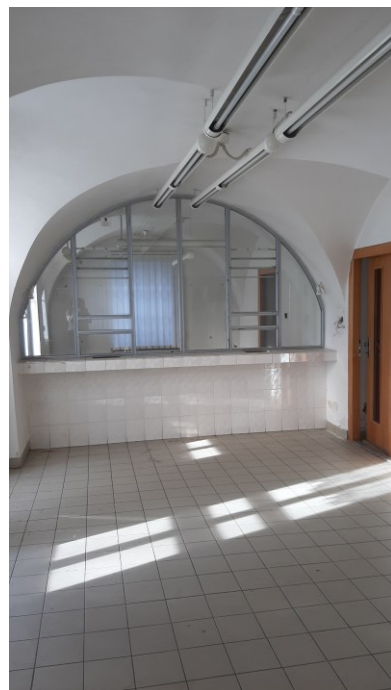
Budoucí přepážka infocentra