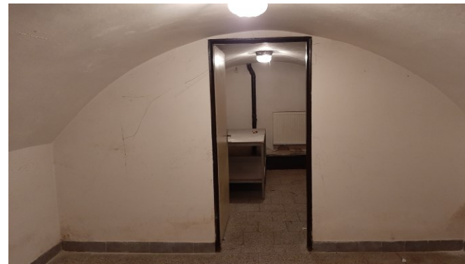
Budoucí sklad knihovny