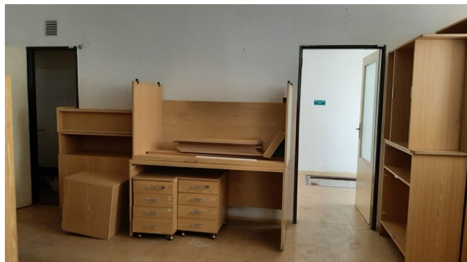
Budoucí knihovna pro dospělé