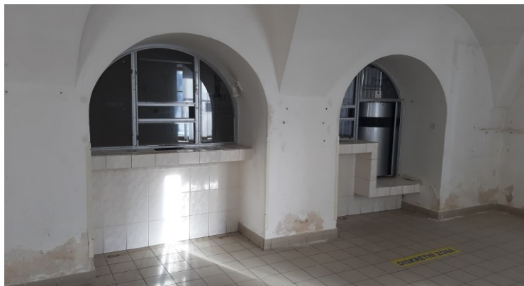
Demolice přepážek České pošty