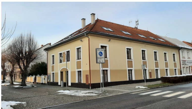
Budova č.p. 41