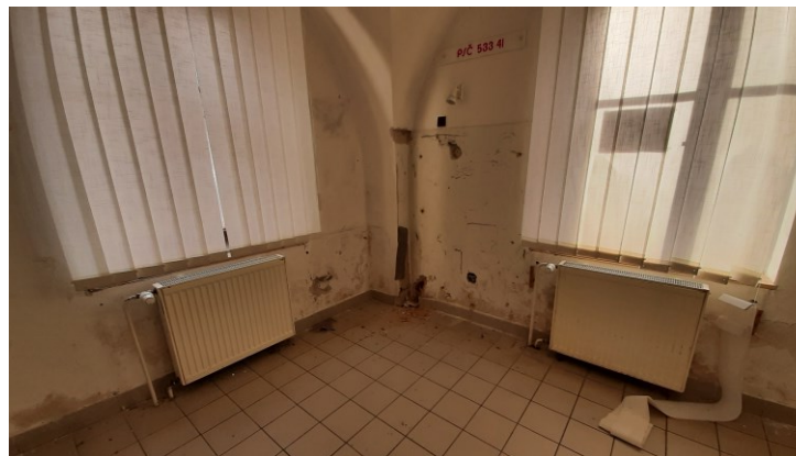
Odstranění zemní vlhkosti