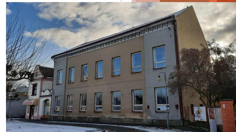
Bývalá škola - městská knihovna